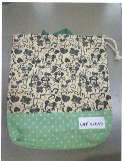
縦 33cm位 × 28cm位

☆トレーニングシャツ・ショートパンツ・スモックを入れて持ち帰ります。左記のような袋をお作りください。ひもの長さは、袋の口を開けた分の長さにとよいかと思えます。