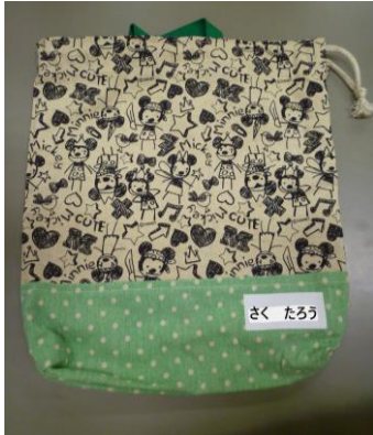
縦 33cm位 × 28cm位

☆トレーニングシャツ・ショートパンツ・スモックを入れて持ち帰ります。左記のような袋をお作りください。ひもの長さは、袋の口を開けた分の長さにするとういかに思います。