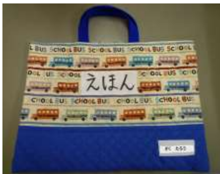
縦 30 cm 位 × 40 cm 位

☆全園児対象に図書の貸出を行います。そこで、図書専用の袋を左記のようにご用意ください。貸出方法等詳細は、後日学年だよりでお知らせします。