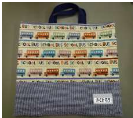
縦 30 cm 位 × 横 40 cm 位

☆汗拭きタオル・上履き・上履き袋・運動帽子を入れて、 毎週末に持ち帰りますので 、翌週上記の荷物を入れ持たせてください。