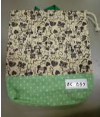
縦 33 cm 位 × 28 cm 位

☆トレーニングシャツ・ショートパンツ・スモックを入れて持ち帰ります。左記のような袋をお作りください。ひもの長さは、袋の口を開けた分の長さにするとういかに思います。